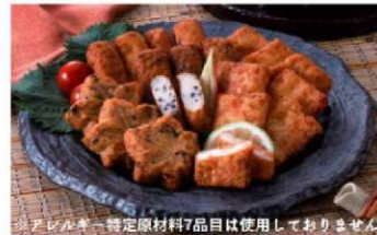
※アレルギー特定原材料7品目は使用しておりません。

「きくらげ」「ごぼう」「ごま」の3種類の野菜が具材に入り コリコリした食感と一味唐辛子がピリッと効いた商品です。